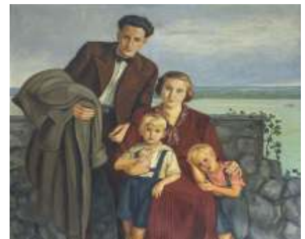
34. WLASTIMIL HOFMAN (1881-1970) Rodzina Potockich, 1934 olej, płótno; 136 x 153 cm; sygn. l. d.: Wlastimil/ Hofmann/ 1934