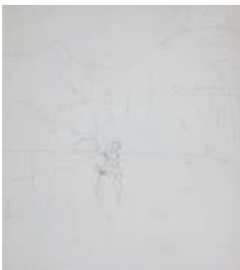
14. JACEK MALCZEWSKI (1854-1929) Szkic wiejskiej kobiety na tle pejzażu, ok. 1890 ołówki, papier; 22,5 x 15,5 cm