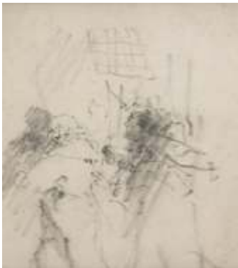
8. JACEK MALCZEWSKI (1854-1929) Studia figuralne, ok. 1875 kredka czarna, papier; 23 x 21 cm