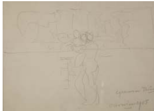
12. JACEK MALCZEWSKI (1854-1929) Szkic postaci - Egzamin, Czerwiec 1905 ołówki, papier; 21,5 x 28 cm; dat. p. d.: Egzamin, czerwiec 1905