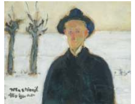
37. WLASTIMIL HOFMAN (1881-1970) Jacek Malczewski, ok. 1960 olej, tektura; 13,5 x 17,4 cm; sygn. l. d.: Wlastimil Hofman