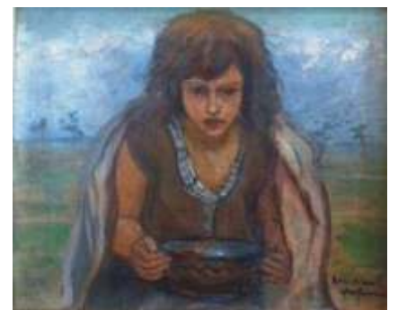
40. WLASTIMIL HOFMAN (1881-1970) Portret dziecka olej, płótno; 16,5 x 19,5 cm; sygn. p. d.: Wlastimil Hofman