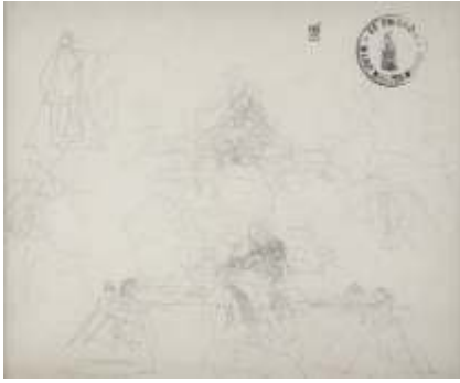
17. JACEK MALCZEWSKI (1854-1929) Szkice grupy figuralnej- Madonna z Dzieci tkiem, ok. 1900 ołówek, papier; 18 x 22 cm