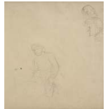
10. JACEK MALCZEWSKI (1854-1929) Kluczyk męczynna i szkice twarzy, ok. 1873? ołówki, papier; 25 x 19,5 cm