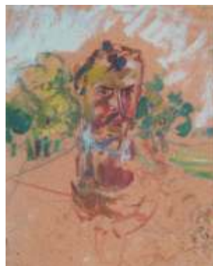
39. WLASTIMIL HOFMAN (1881-1970) Autoportret, ok. 1910 olej na podrysowaniu ołówkiem, tektura; 16,8 x 13,3 cm