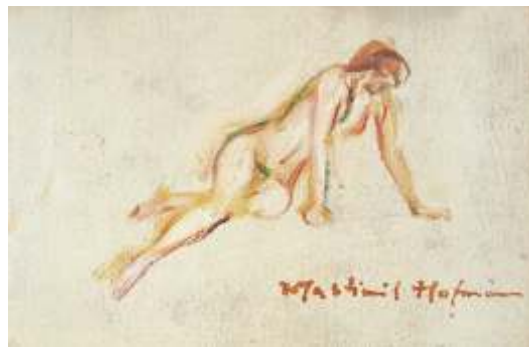
24. WLASTIMIL HOFMAN (1881-1970) Akt 1 olej, tektura; 8 x 12 cm; sygn. p. d.: Wlastimil Hofman