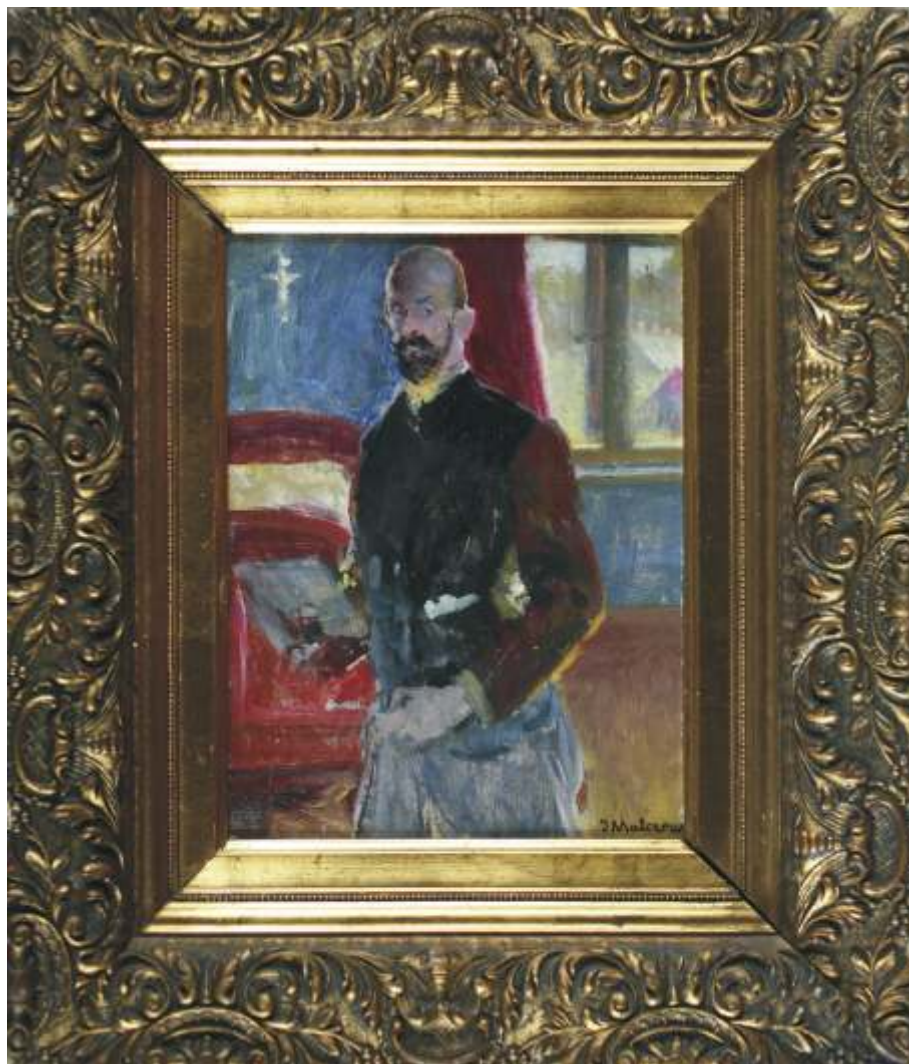
1. JACEK MALCZEWSKI (1854-1929) Autoportret z palet , ok. 1910 olej, tektura; 29 x 22 cm; sygn. p. d.: J Malczewski

JACEK MALCZEWSKI - VLASTIMIL HOFMAN SAMORZ DOWE CENTRUM KULTURY W MIELCU 9.11.2017 - 21.12.2017