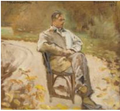
5. JACEK MALCZEWSKI (1854-1929) Portret Rafał Malczewskiego, 1921 olej, sklejka; 51 x 54 cm; sygn. l. g.: J Malczewski i dat. p. g.: Pa dziernik 1921