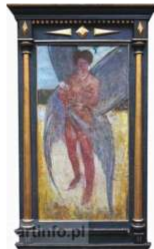
4. JACEK MALCZEWSKI (1854-1929) Thanatos, po 1926 olej, sklejką; 99,5 x 53 cm; sygn. l. d.: J. Malczewski