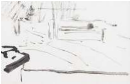
20. JACEK MALCZEWSKI (1854-1929) Szkic plenerowy tuszu lawowany, papier; 10,5 x 17 cm