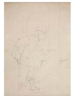
16. JACEK MALCZEWSKI (1854-1929) Skradająca się postać z torbami ołówki, papier; 25,5 x 18 cm