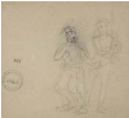
11. JACEK MALCZEWSKI (1854-1929) Studia postaci - kat i ofiara, ok. 1875 ołówki, papier; 19 x 21 cm