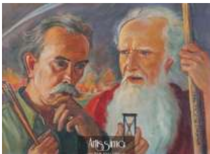
35. WLASTIMIL HOFMAN (1881-1970) Chronos, 1941 olej, sklejk; 34 x 47 cm; sygn. przy prawej kraw dzi: Wlastimil Hofman 1941/ Tel Aviv