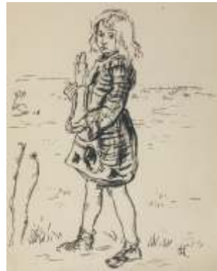
21. WLASTIMIL HOFMAN (1881-1970) Dziewczynka z figurk litografia, papier; 19 x 13,5 cm; sygn. p. d.: WH (monogram wi zany)