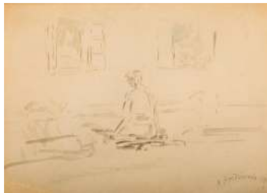
9. JACEK MALCZEWSKI (1854-1929) Thanatos, 1918 tuszczyk lawowany, papier; 32,5 x 46 cm; dat. p. d.: 8 pa dziernik 1918