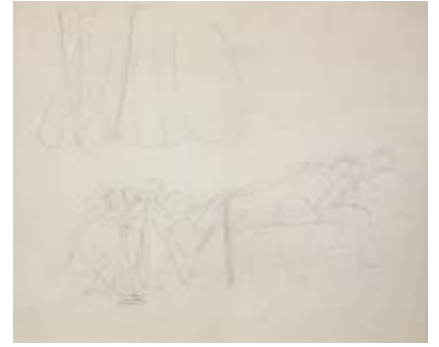
19. JACEK MALCZEWSKI (1854-1929) Szkic litery „M” do winiety czasopisma „Moda”, ok. 1873? ołówek, papier; 17 x 21,5 cm