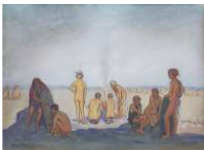
38. WLASTIMIL HOFMAN (1881-1970) Na pla y, 1932 olej, płótno; 31 x 42 cm; sygn. i dat. l. d.: Wlastimil Hofman 1932