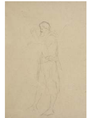
13. JACEK MALCZEWSKI (1854-1929) Męczynna z brodem ołówki, papier; 25 x 19,5 cm