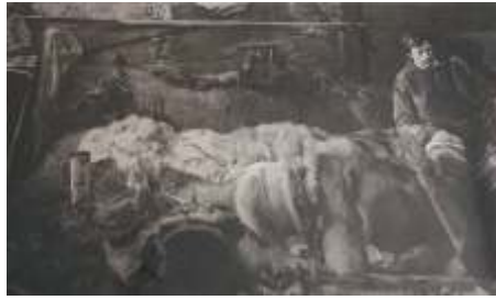
6. JACEK MALCZEWSKI (1854-1929) mier Ellenai heliograwiura; 35 x 61,5 cm