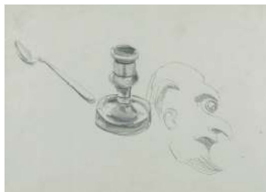
15. JACEK MALCZEWSKI (1854-1929) Studia lichterza, tyłek, rysunek satyryczny głowy męczynna z profilem ołówki, papier; 16,7 x 24,6 cm