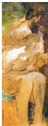
2. JACEK MALCZEWSKI (1854-1929) Przy płocie, 1916 olej, płótno; 152,5 x 53,5 cm; sygn. l. d.: Jacek Malczewski