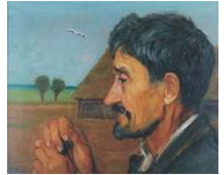
31. WLASTIMIL HOFMAN (1881-1970) Melancholia, ok. 1930 olej, tektura; 37,5 x 49,5 cm; sygn. l. d.: Wlastimil/ Hofman