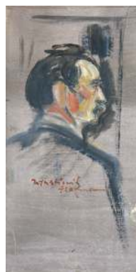
27. WLASTIMIL HOFMAN (1881-1970) Autoportret? olej, tektura; 18 x 8,5 cm; sygn. r.: Wlastimil/Hofman