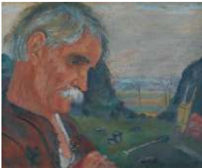
32. WLASTIMIL HOFMAN (1881-1970) Powrót, 1947 olej, tektura; 38 x 46,5 cm; sygn. p. d.: Wlastimil Hofmann/ Szklarska Por ba 1947